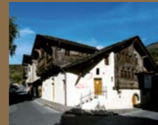
Musée du Vin – Salgesch