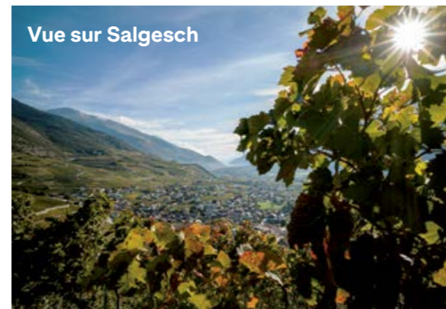
Vue sur Salgesch