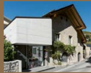
Musée du Vin – Sierre

Situé au cœur du Valais, le Musée du Vin comprend le sentier viticole et deux espaces d'exposition : l'un dans l'enceinte du Château de Villa à Sierre et l'autre dans le village vigneron de Salgesch. Le Musée du Vin – Sierre présente des expositions thématiques temporaires. Dans l'espace permanent de Salgesch, découvrez les secrets des vins valaisans et partez à la rencontre de cette viticulture de montagne millénaire. Un riche programme d'évènements et des activités de médiation culturelle sont proposés au public.