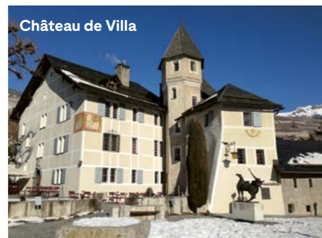
Château de Villa