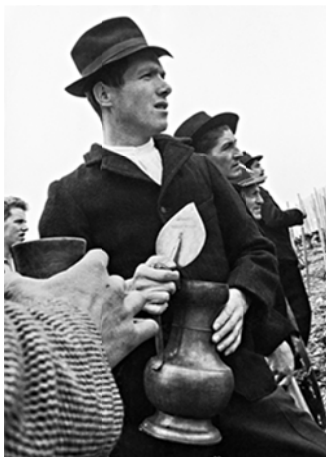
Tournage du film "Le président de Viouc", Sierre, 1968