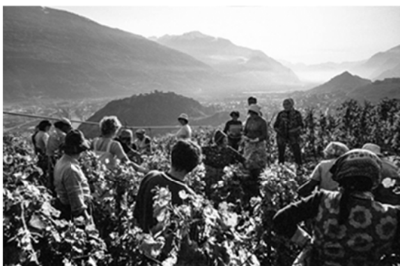
Maison Charles Bonvin, vendanges. Champlan, vers 1970.