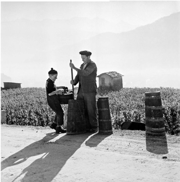
Vendanges à Mollignon, vers 1970-80,

Le fonds Oswald Ruppen a été déposé à la Médiathèque Valais - Martigny en 2008. Parmi ces images illustrant le quotidien social et économique du canton, beaucoup racontent la vigne et le vin. Or, cette thématique de l'œuvre du photographe reste pour une grande part méconnue. Le Musée valaisan de la Vigne et du Vin cherchait à exploiter ces images pour montrer le regard particulier d'Oswald Ruppen sur le monde vitivinicole valaisan et ses transformations profondes au XXe siècle. De son côté, la Médiathèque Valais - Martigny souhaitait valoriser ce patrimoine photographique remarquable. Les deux institutions ont tout naturellement uni leurs compétences pour monter un projet d'ouvrage et d'exposition ensemble, avec l'aide du photographe Robert Hofer, ancien apprenti, ami et grand connaisseur de Ruppen.