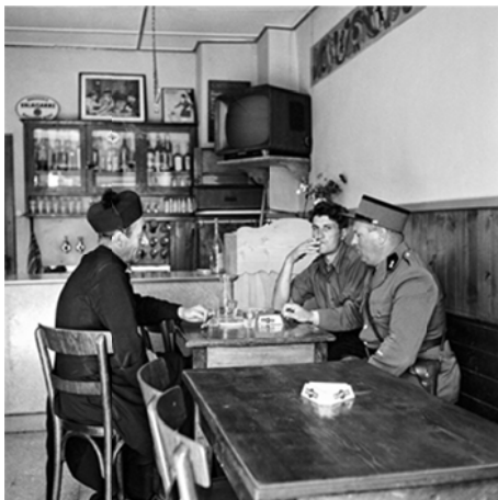
Scène de bistrot, 1958