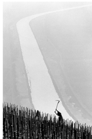
Travail du sol, Molignon, 1964