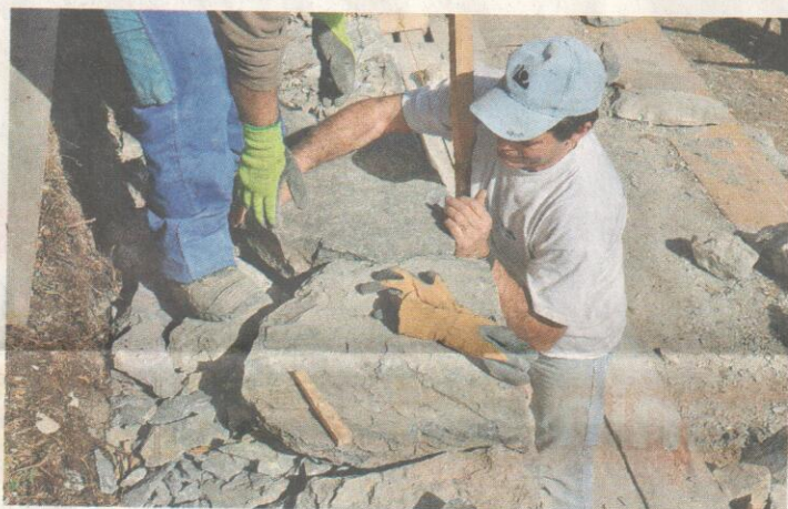
L'Etat du Valais a mis sur pied un plan de sauvegarde des murs en pierres sèches.